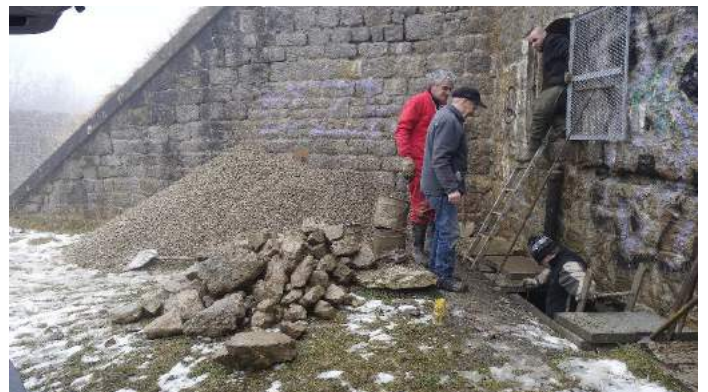
Les pierres étaient au fond des filtres et le gravier par dessus.