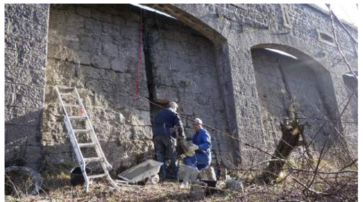
Suite à un acte de vandalisme, au printemps 2016, sur le rempart ouest, nous avons commencé les réparations.