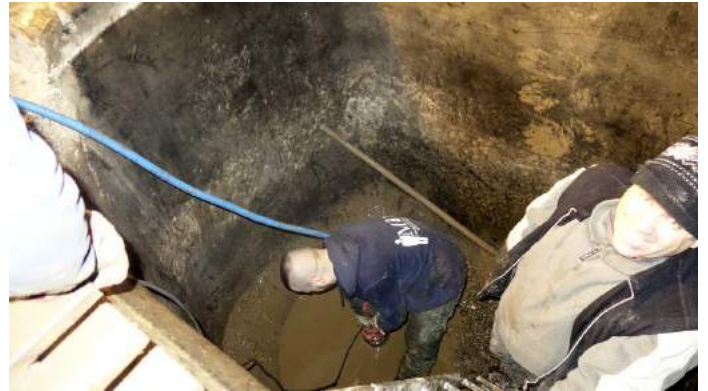
Et à la fin