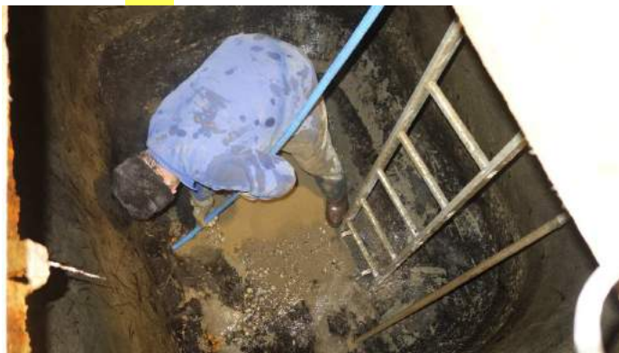
Ça c'est le deuxième, après vidange