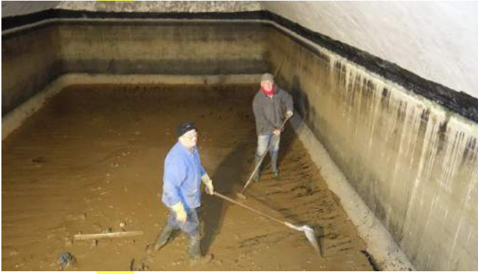
Il n'y a plus qu'à fignoler le nettoyage, enfin presque... Il faut encore vider les deux filtres remplis de gravier.